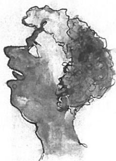
Victor HUGO, Tête de profil , plume, pinceau, encre brune et lavis, réserves sur papier beige, n°33 du Théâtre de la Gaité , vers 1864-1869, BnF.

3. Adeptes d'une croyance en la lutte entre Bien et Mal.